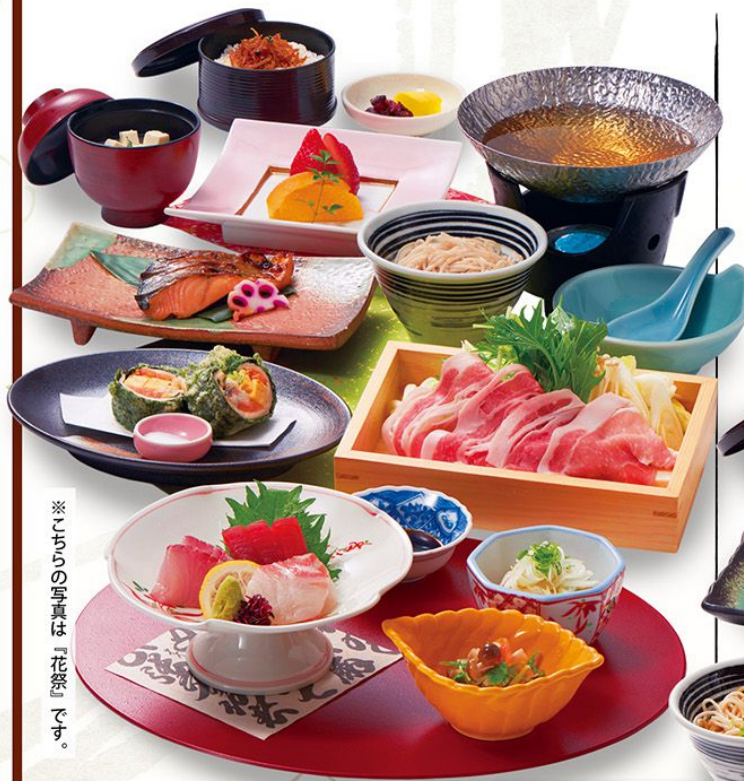
※こちらの写真は「花祭」です。