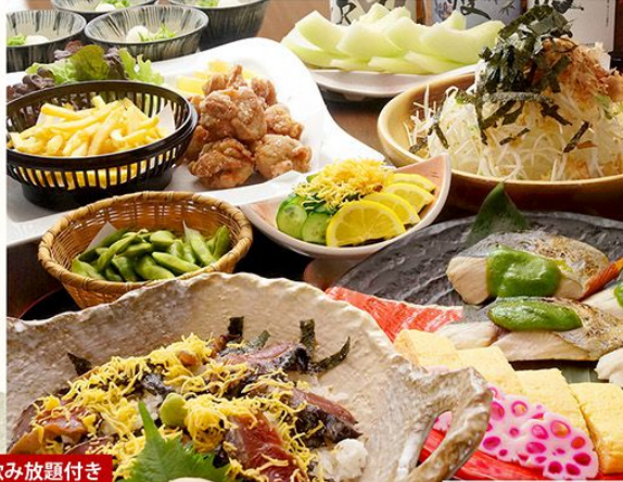
※「宴」の写真は4人前です。